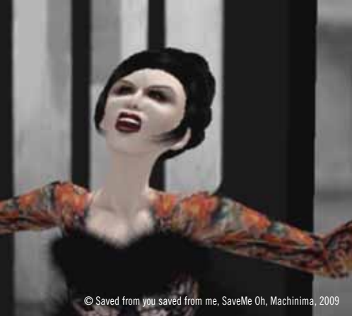
© Saved from you saved from me, SaveMe Oh, Machinima, 2009