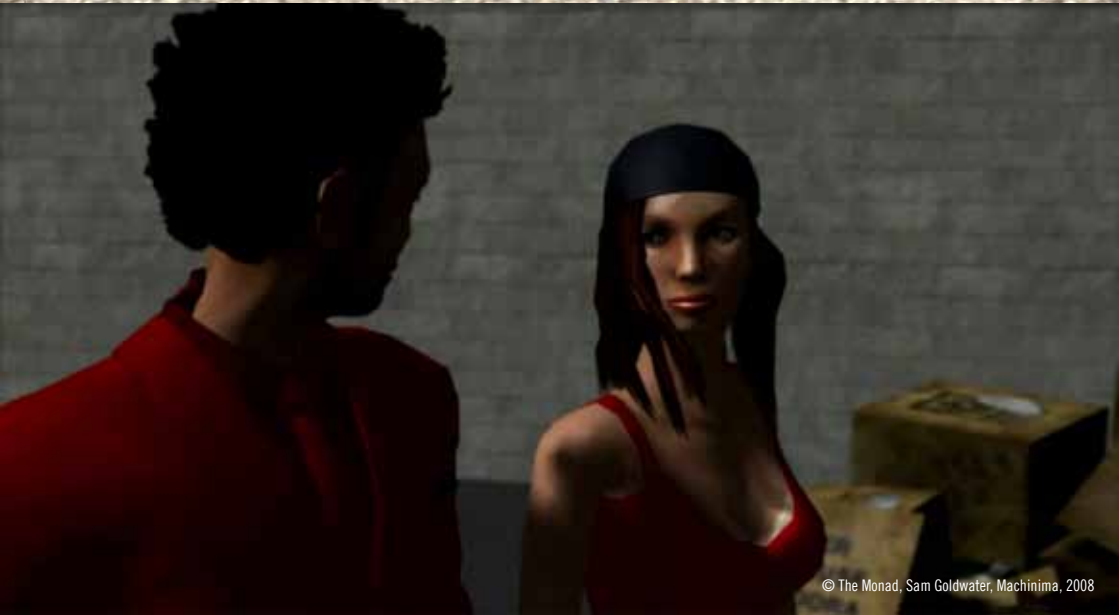
© The Monad, Sam Goldwater, Machinima, 2008