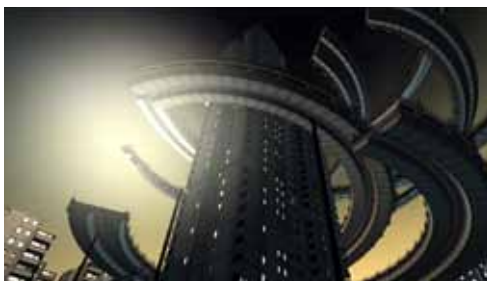
© fr-041 : débris, Farbrausch, Windows, 2007