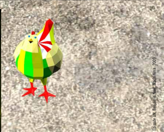
© L'Hotel: Episode UN, Benjamin Nuel, Machinima, 2009