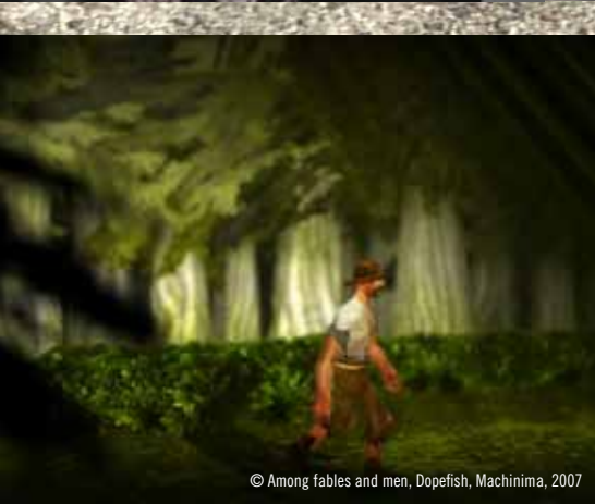
© Among fables and men, Dopefish, Machinima, 2007