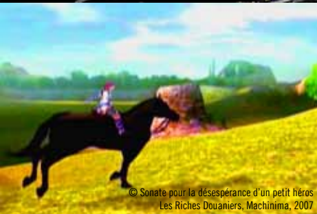
© Sonate pour la désespérance d'un petit héros Les Riches Douaniers, Machinima, 2007