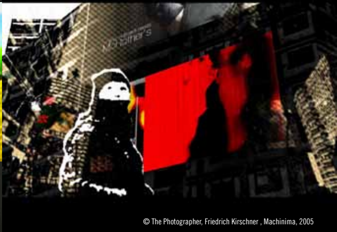
© The Photographer, Friedrich Kirschner, Machinima, 2005