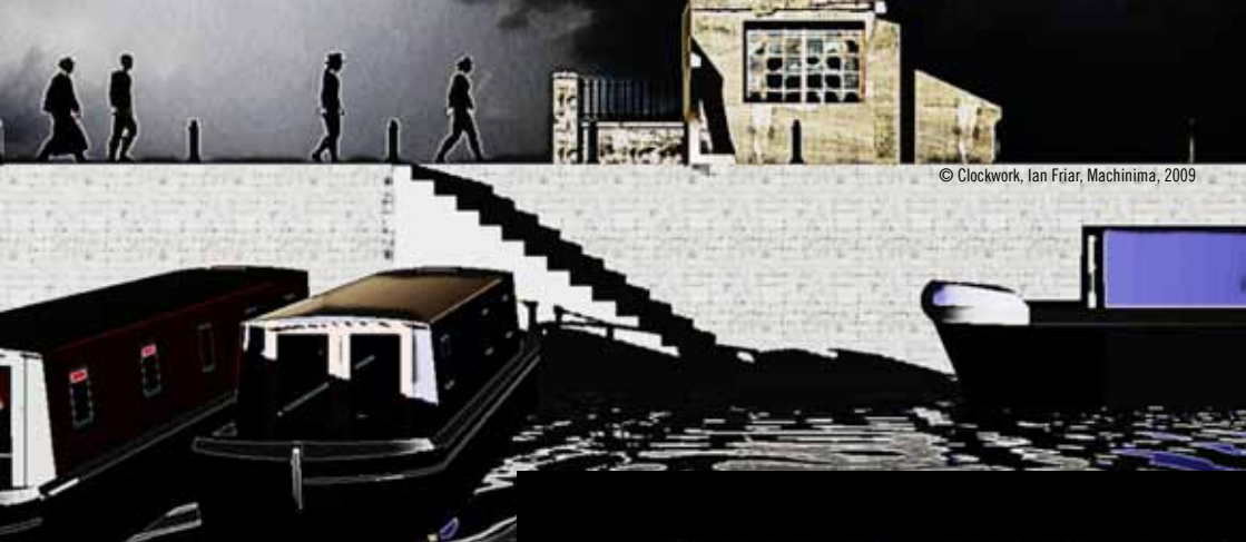
© Clockwork, Ian Friar, Machinima, 2009