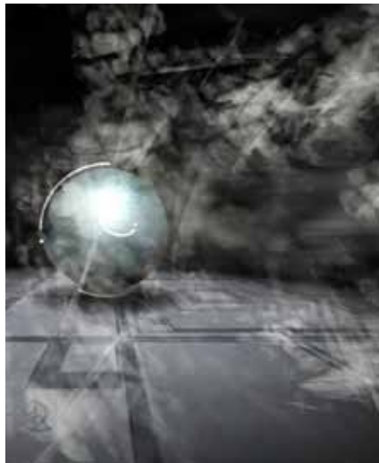
© fr-055 : 828, Farbrausch, Windows, 2007

Projections permanentes de 12H à 18H45 Au Carrefour numérique (niveau -1), Studio