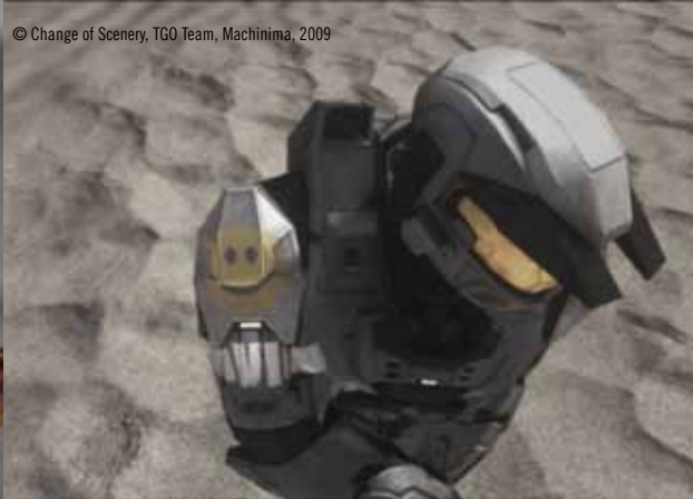
© Change of Scenery, TGO Team, Machinima, 2009