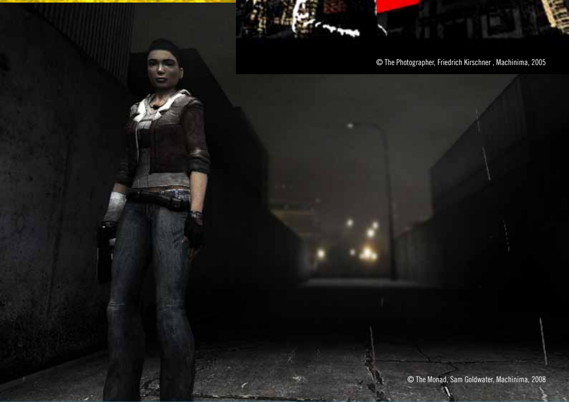
© The Monad, Sam Goldwater, Machinima, 2008