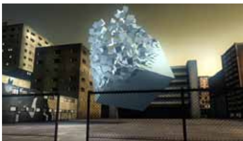
© fr-041 : débris, Farbrausch, Windows, 2007